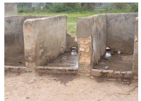
oud toilet jongens

der Veen, heeft voor de kinderen ter ere van in het gebruik nemen van het Ecosan toilet een drama voorstelling geregeld voor alle 1700 leerlingen. Een heugelijke feestdag.