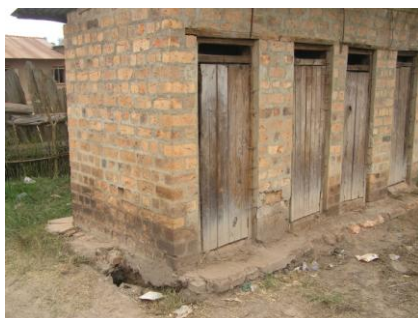
Oud toiletgebouw meisjes