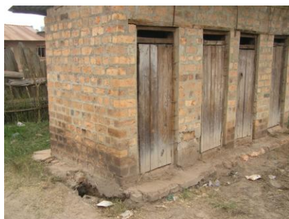
Oud toiletgebouw meisjes